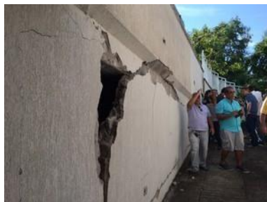
Figura 1: Rachadura em fachada na Vila do Pan.

Com isso, houve recalque. Rachaduras apareceram (Figura 1), o terreno cedeu, danos às tubulações foram provocados, e os imóveis foram desvalorizados. (MACEDO, 2017)